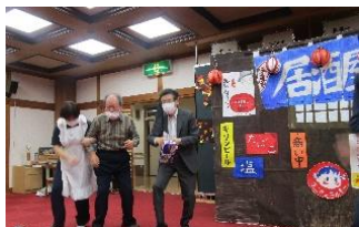
昭和仮装ショー、 昔どこかでみたような、 レトロ感たっぷり