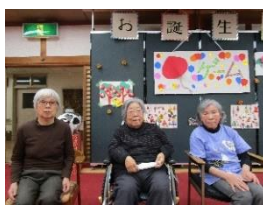
忘年会を兼ねて 歌合戦