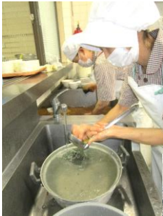
洗い物も ハンパないです(^_^)