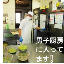
男子厨房 に入っ てます!