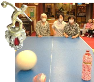
「ソーレツ!!」「エイツ!!」 ~さて、何本倒れたかな?