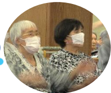
ボーリングの前に ラジオ体操で体を ほぐしましょう!