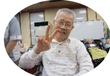
デイさん、合計22点!! 総合優勝です(^_^)v