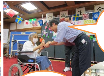
おめで たござ います!