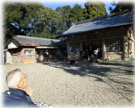
狛犬さんと一緒に撮りました(^_^)