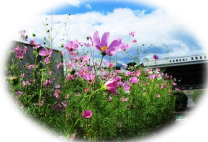
園庭のコスモスがやっと咲きそろいました