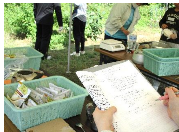
チェック表とにらめっこ