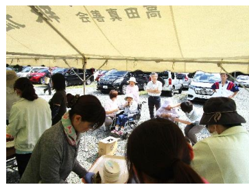
外で作るのは大変やあ・・・