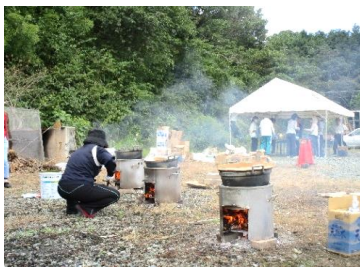
煙が目にしみる・・・