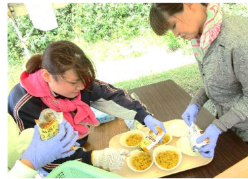
ドライカレー・・・割とおいしそう！