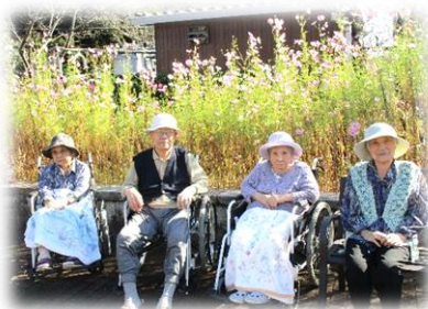
今日はいい天気です♡