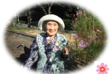
女優さんのフロマイドみたい！