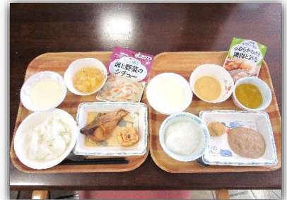
普通食と超キザミ食・・・結構ボリュームあり！