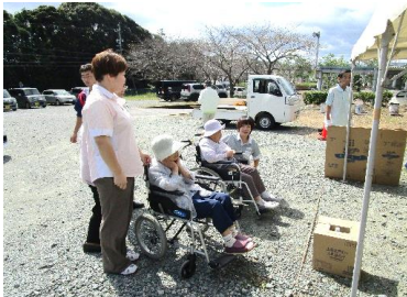
炊き出しを思い出すわあ・・・