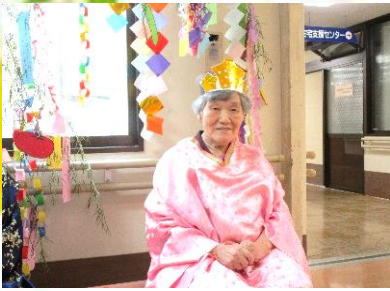
ちょっと大人の織姫・彦星