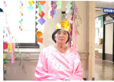
照れくさいけど・・・