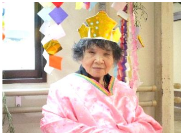
とっても！お似合い